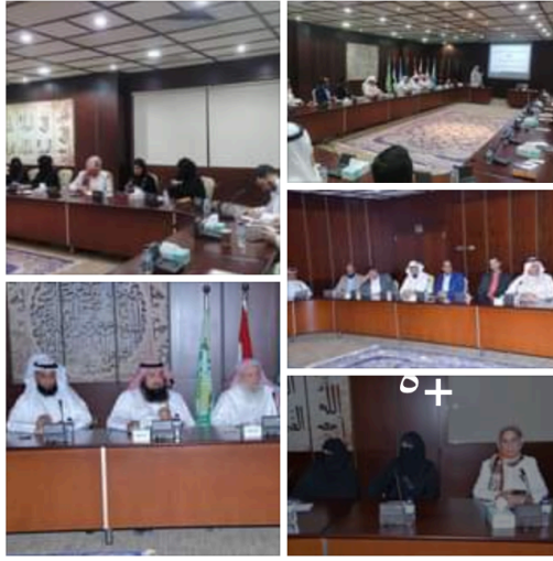
الشبكة الإقليمية للمسؤولية الاجتماعية 9 ساعات

بمشاركة جمعيات ومؤسسات خيرية وحكومية كويتية